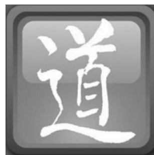
「爾道自建」靈修計劃