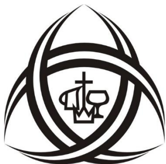
加拿大華人宣道會聯會