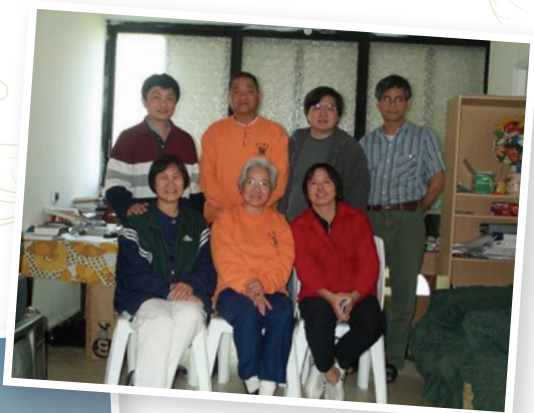
↑ 七位華人事工同工