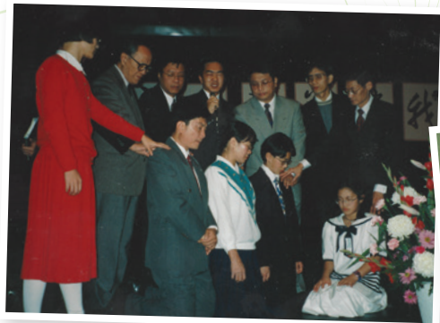
← 聯合差傳年會藤牧師 主持差遣禮